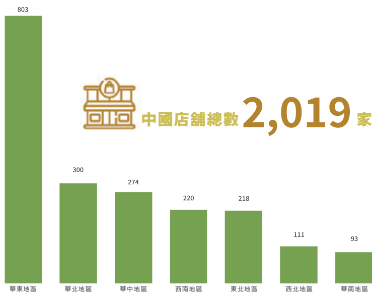
中國內地、中國香港及中國台灣地區店舖總數及其地理分佈